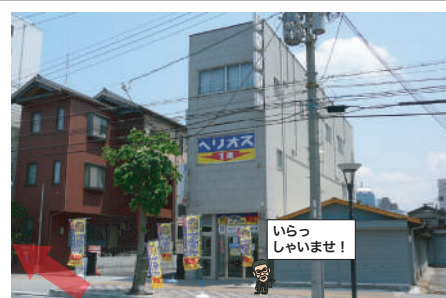
3 ヘリオス大阪に到着です。 ★1階の黄色い看板のお店です。