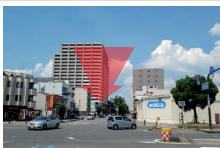
2 ウェルシアの角をまがり開口神社をすぎて、 すぐ右手にヘリオス大阪が見えます。