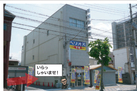
3 ヘリオス大阪に到着です。 ★1階の黄色い看板のお店です。