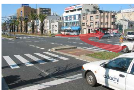
1 ウェルシアの角を曲がります。 [310号線から]ウェルシアが右手に、ごぞいます。 [26号線から]ウェルシアが左手に、ごぞいます。