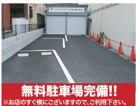
※お店のすぐ横にごぞいますので、ご利用下さい。