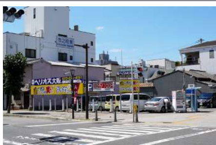
2 左手に金プラ買いの看板が見える交差点 を左に曲がります。右手にローソンがごぞいます。