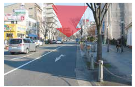
3 池田泉州銀行を左手に見ながら、 東へ一直線にお進み下さい。