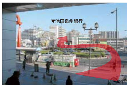
2 正面にロータリーがございます。 池田泉州銀行を目指して進み下さい。