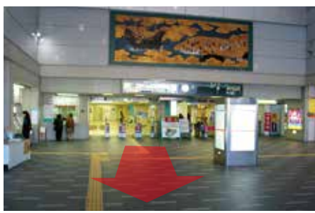
1 東口改札を出て下さい。 (ホテルアゴラーリジェンシー大阪堺と逆側の出口)