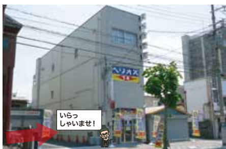
6 ヘリオス大阪に到着です。 ★1階の黄色い看板のお店です。