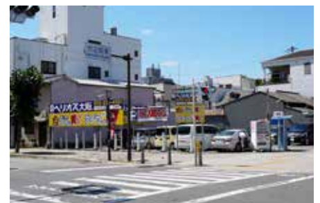
コインパーキングに金プラ買いの看板 がございます。