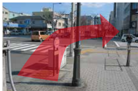
5 左手向かいにローソンがございます。 この交差点を渡って右折していただきましたら20メートル先!