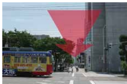
4 阪堺線(路面電車)「大小路駅」を渡ります。 紀陽銀行側へお渡り下さい。